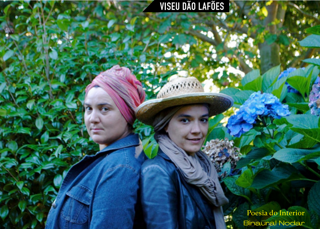
Poesia do Interior Binaural Nodar