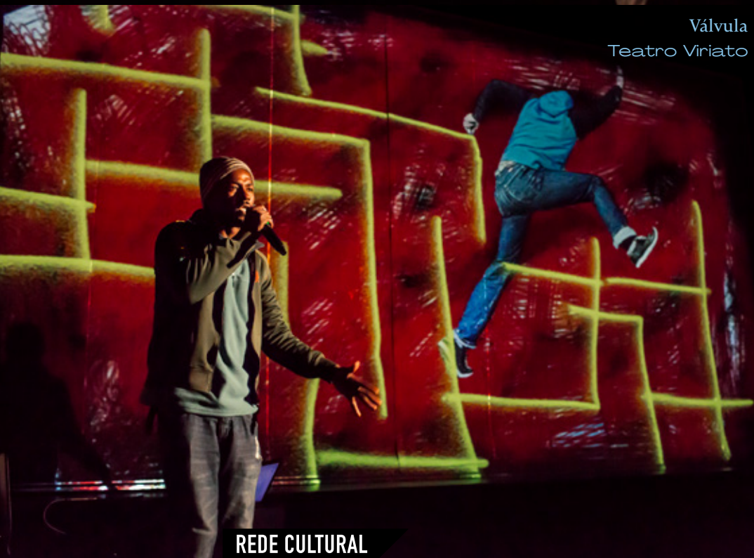
Válvula Teatro Viriato