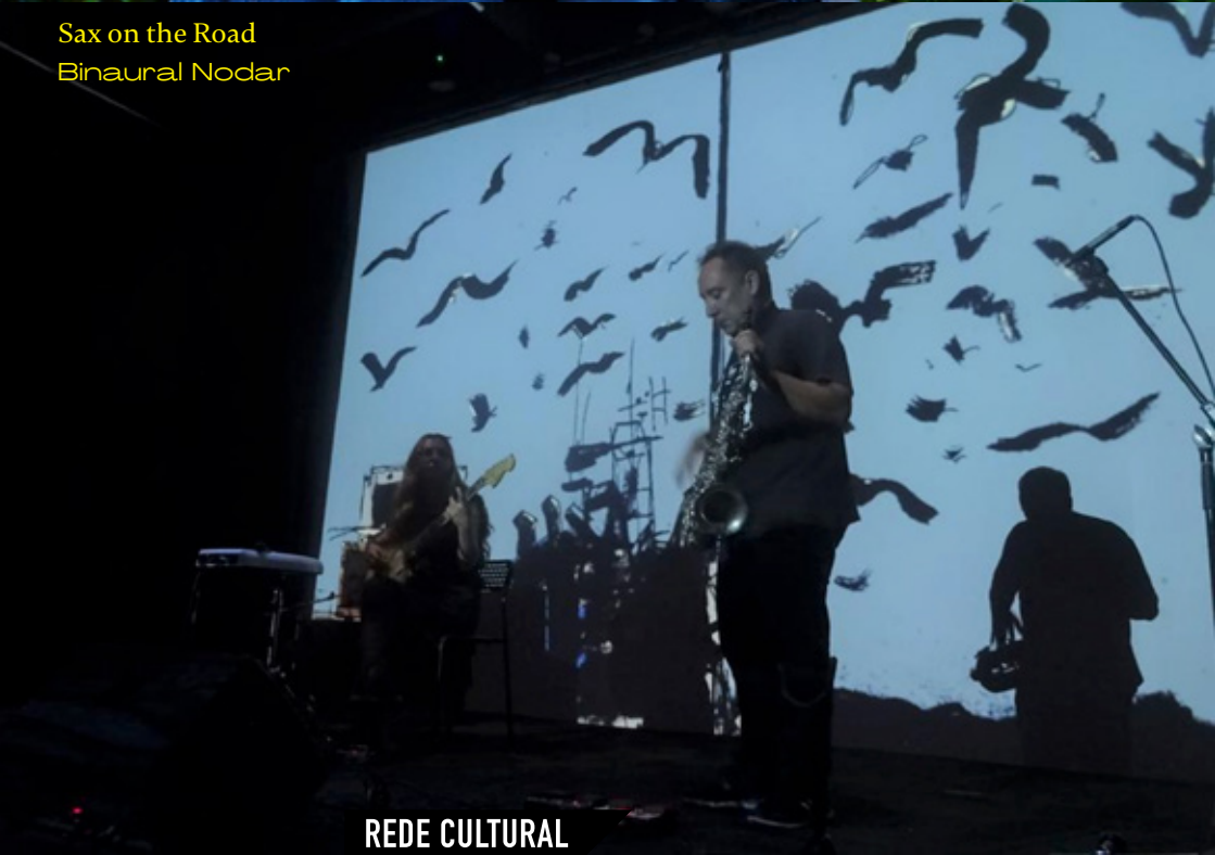
Sax on the Road Binaural Nodar