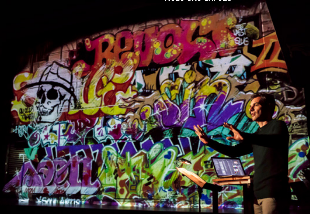
Válvula Teatro Viriato