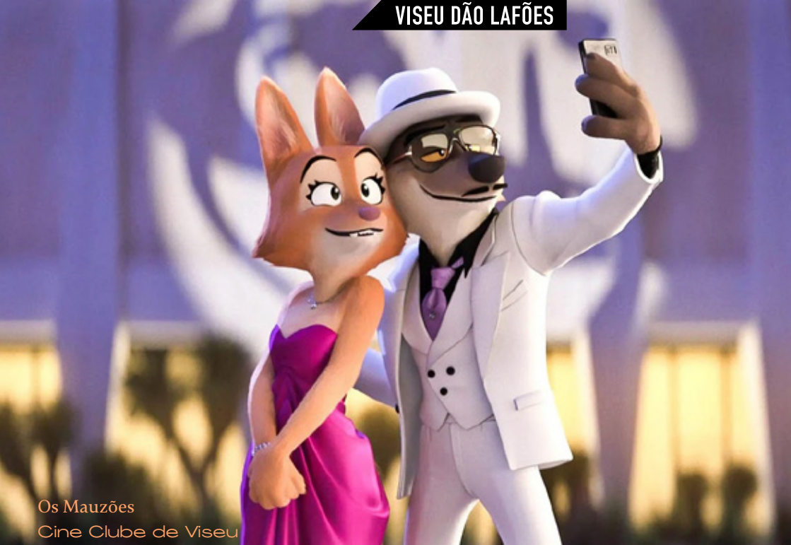
Os Mauzões Cine Clube de Viseu