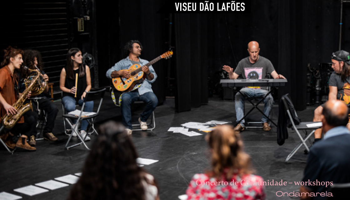
Concerto de Comunidade – workshops Ondamarela