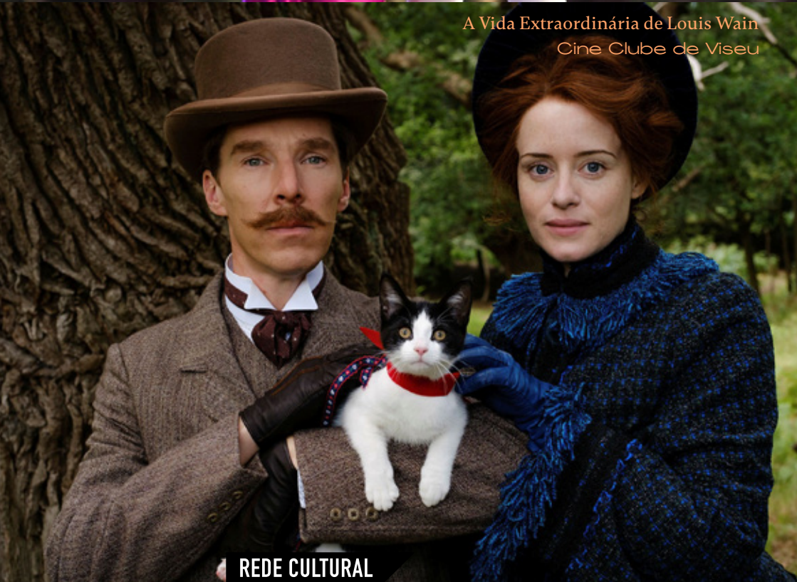
A Vida Extraordinária de Louis Wain Cine Clube de Viseu